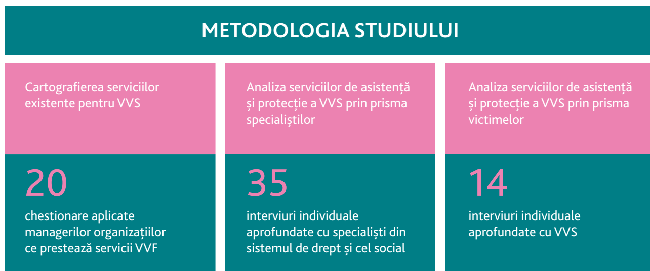
FIGURA 1 / EȘANTIONUL CERCETĂRII

În cadrul acestui studiu au fost colectate date din diferite unități teritoriale administrative ale Republicii Moldova. Totuși predomină specialiștii din mun. Chișinău, pentru